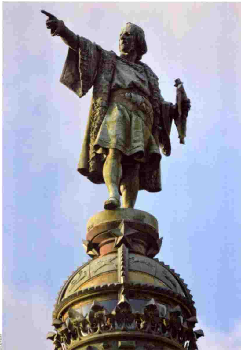
Colom va fer de corsari a la guerra civil catalana, l'any 1472. Del bàndol de la Generalitat.