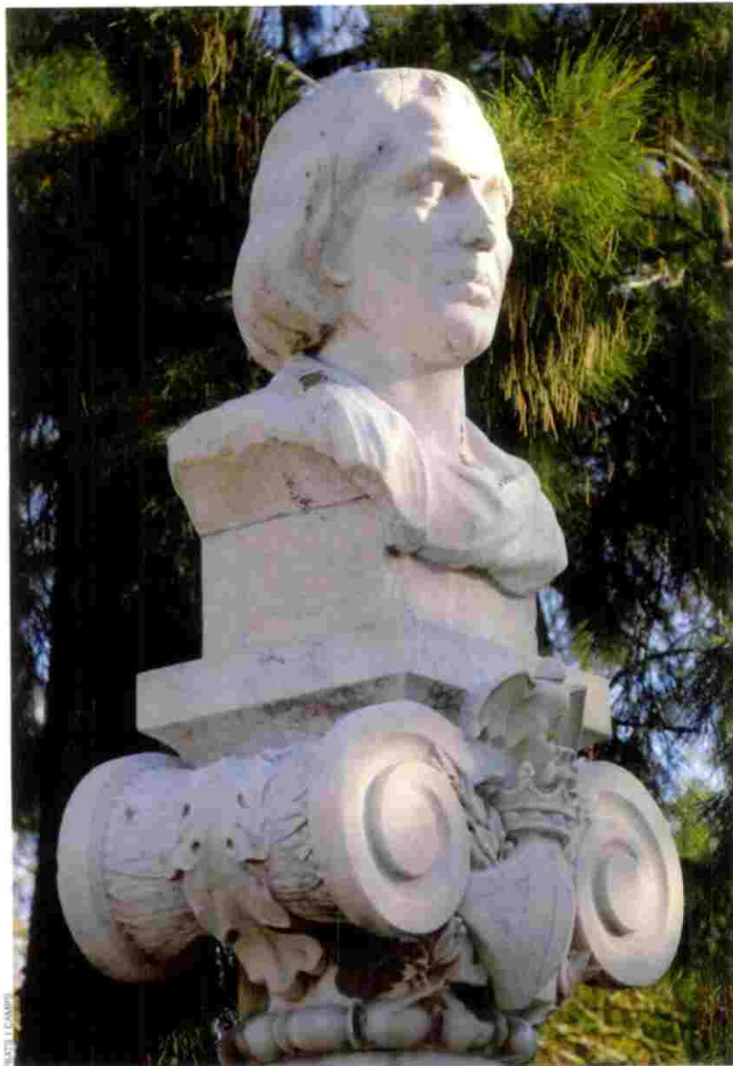
A la ciutat de València hi ha una estàtua de Lluís de Santàngel, factòtum del viatge de Colom.

de nau, a les ordres de Renat; segon, que visqués a Marsella; i tercer, que estigués a favor de Catalunya durant la guerra civil." El cas és "no acceptar que ja era capità de nau el 1472". Entre l'hivern del 1471 i la primavera del 1472, exactament, han pogut situar l'episodi.