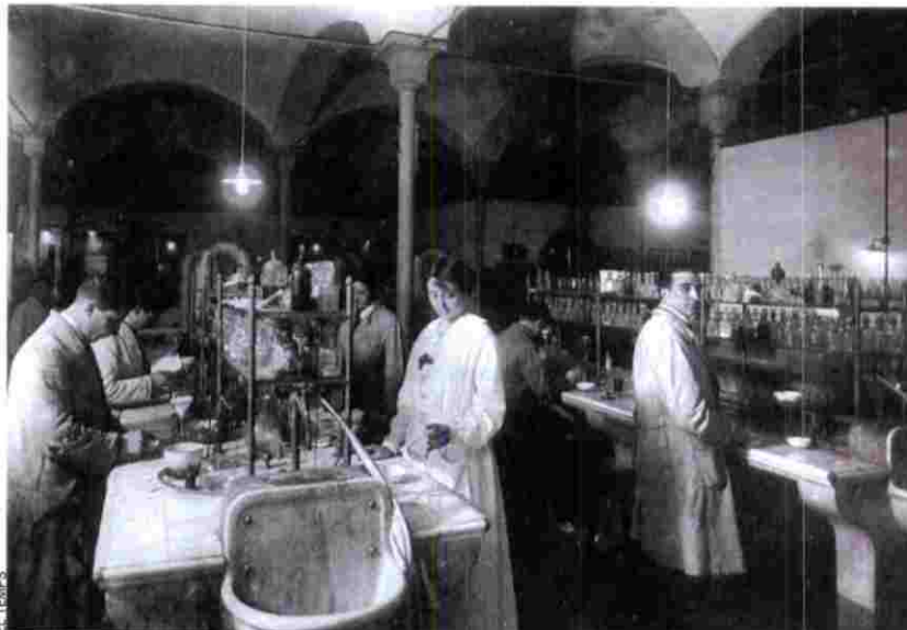
Laboratori d'Estudis Superiors de Química a l'Escola Industrial, a Barcelona. Són les primeres dècades del segle XX.

Al costat de Munyós, i per esmentar un altre científic d'un altre segle i un altre camp, podríem col·locar (per exemple, sempre per exemple) la figura del botànic valencià Antoni Josep Cavanilles. O, abans, la de la nissaga barcelonina dels Salvador. O la del naturalista nord-català "injustament oblidat" Pere Barrère. Som al segle XVIII, ja, quan "els coneixements referents a la diversitat dels éssers naturals" es configuren "com una nova disciplina científica": es parteix de "la cultura de la curiositat per les meravelles i les rareses de la natura" pròpia de la centúria anterior, s'eixampla "el camp d'observació amb els avenços de l'òptica", s'intenta "posar ordre en els microcosmos que constituïen les col·leccions dels curiosos" i s'obren camí "noves sistemàtiques" que culminen en l'obra de Carl von Linné, el naturalista suec que va propiciar una nova i més clara classificació dels éssers vius coneguts, agrupats en classes, ordres, gèneres i espècies. Tal com ens expliquen els responsables del capítol "La botànica i els sabers naturalístics i agronòmics" (Josep Maria Camarasa, Agustí Camós i Cristina Sendra), "la