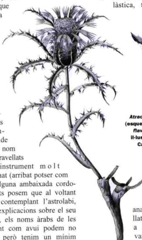
Atractylis humilis (esquerra) i Carduus flavescens , en il·lustracions de Cavanilles.

Demanem, per tant, d'entrada disculpes pel resum esbiaixat i ens endinsem ràpidament en el Renaixement i en l'ebullició científica que, també, va afectar les nostres terres, en la diversificació dels centres de transmissió i producció del saber, en la "recuperació de la cultura i el saber clàssics" (però també amb una "posició crítica" davant seu), en "la valoració positiva de la tècnica", "la formulació clara de la idea de progrés, basada en les conquestes de la tècnica" i en les seves realitzacions en associació amb la ciència, en els descobriments geogràfics o l'arribada de la impremta i la seva