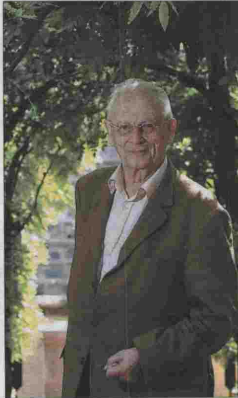
Alain Touraine, en Barcelona.

Es la tesis de su último libro, La mirada social (Paidós), sobre el que hace varios días impartió un seminario y una conferencia en Barcelona, invitado por el Institut d'Estudis Catalans. El mundo ha cambiado mucho en las últimas décadas, dice el reciente premio Príncipe de Asturias de Comunicación y Humanidades, galardón que comparte con Zygmunt Bauman. Las viejas palabras ya no sirven para entender el presente. “El mundo cambia incluso geográficamente”, explica. “No sabemos si Europa, dentro de 50 años, será un continente atrasado o avanzado, porque no tenemos crecimiento, mientras que el resto del mundo sí lo tiene: África y China incluso muy fuerte. Se necesita que los intelectuales den un primer mapa, lleno de errores, pero que indique lo que ocurre. Eso supone que quieran hacerlo, lo que implica resistir a la búsqueda de la celebridad, del