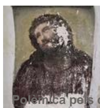
Polèmica pels drets d'autor