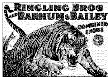
►► Cartell de circ en què es va inspirar Dalí.

►► El món imaginari de Dalí era un univers complex amb multitud de referències. Algunes eren homenajes al passat, com l'elefant-insecte inspirat en Bernini. D'altres, però, s'arrelaven en el present i fins i tot avançaven alguns dels corrents del futur.