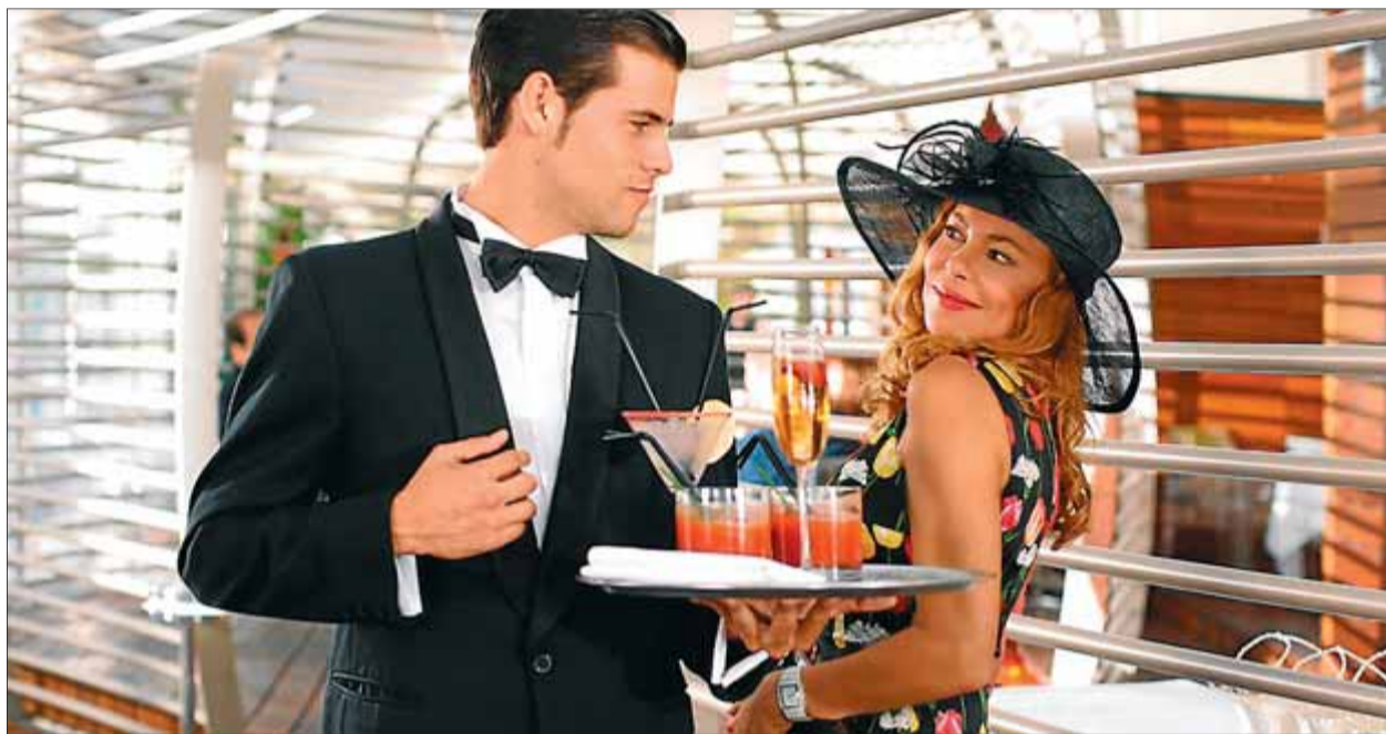
Ana Obregón estrena aquest vespre la sèrie 'Ellas y el sexo débil'

Com ja va passar en la sèrie precedent, Ana Obregón és la principal creadora i supervisora d'aquest nou producte, a més de ser-ne la principal protagonista, en aquest cas la comtessa Carla de Viñacorta, una dona de bona família acos-