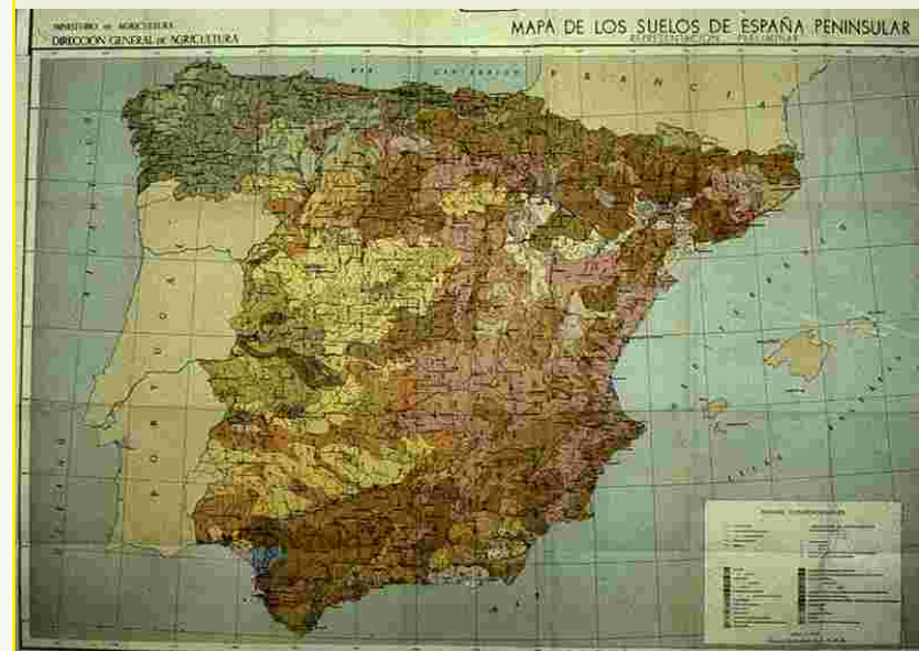
mapa base cartogràfic de l'ICC