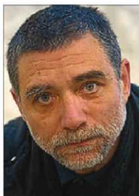
►► Jaume Plensa.