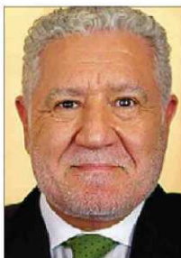
►► Lluís Bassat.