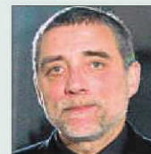
Jaume Plensa Escultor i pintor