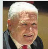
Lluís Bassat Publicista