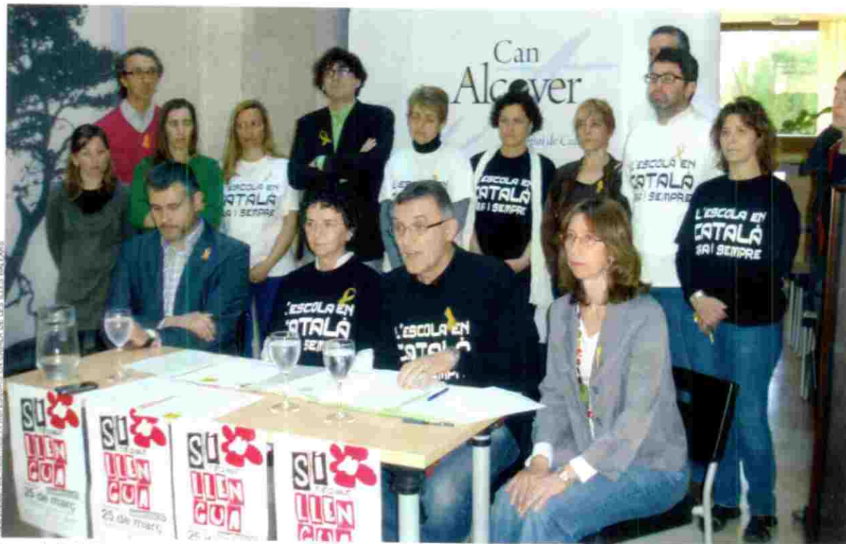
Presentació de l'Assemblea de Mestres i Professors en Català de les Illes Balears, creada per a lluitar contra la política lingüística del PP.