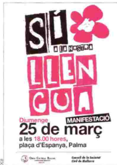
Cartel que convocava la manifestació de diumenge, organitzada per l'OCB.

Quedava IB3. Però des de tot d'una es veié que la ràdio i la televisió públiques de les Balears també sofririen fort i ferm. El govern va anunciar, per una banda, que el pressupost per a enguany seria de 30 milions –era de 57 el 2010 i també el 2011, i més de 100 quan començà les emissions regulars, el 2006–, la qual cosa ha portat a una reducció brutal de programació pròpia; i, per una altra, que allò que no fos producció pròpia –televisions i sèries– seria emès en castellà, perquè "doblar-ho costa molt i no tenim diners". Novament, l'excusa econòmica. Allò que no costa gens, perquè ja ho tenia, és la possibilitat d'emetre en multilingüe, de manera que l'espectador, que d'entrada rebia l'emissió en català, si volia podia rebre-la en versió ori-