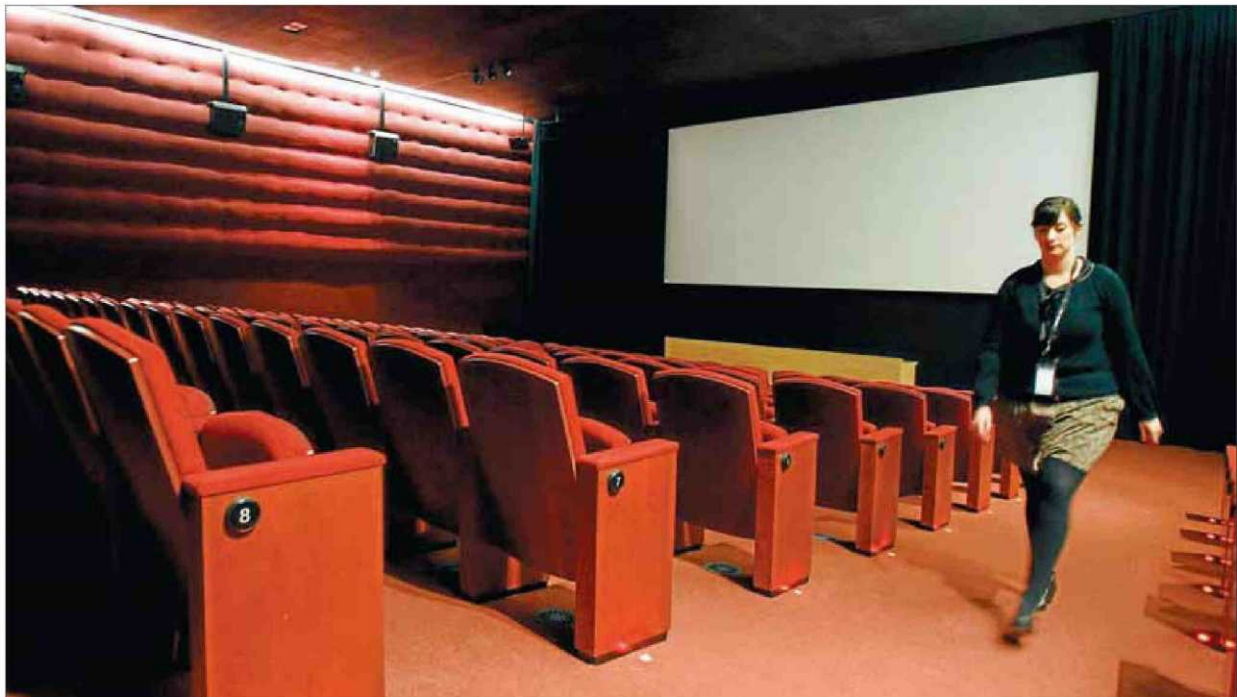
La sala Laya, la més petita de les dues que hi ha a la nova seu de la Filmoteca, té 180 butaques. La sala Chomón en té 375

La pel·lícula argentina El hombre de al lado , votada pels crítics com el millor film estrenat el 2011 a l'Estat espanyol, serà el títol que inaugurarà la nova seu. Tal com fa habitualment, la Filmoteca alternarà diversos cicles simultàniament: retrospectives de Bigas Luna (a qui es de-