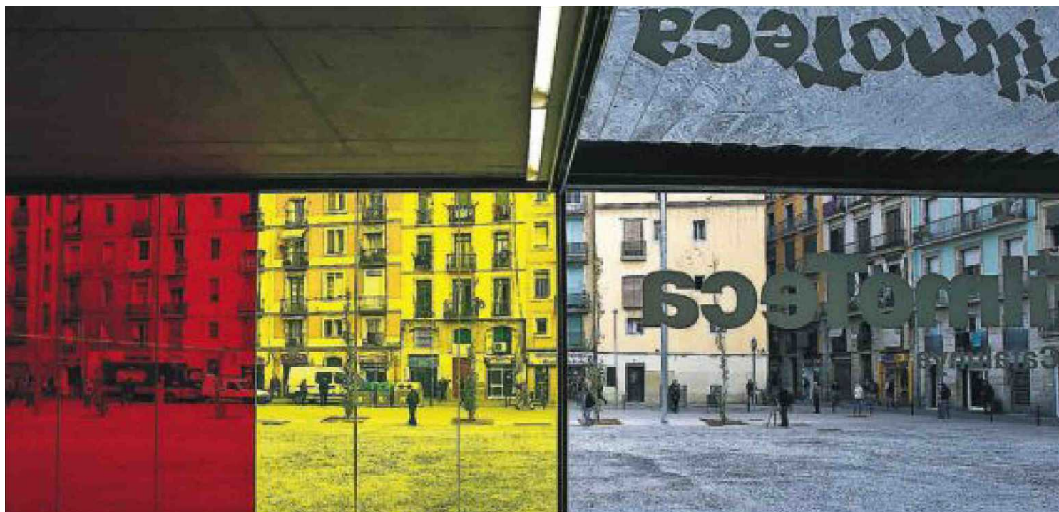
La plaza de Salvador Seguí, vista desde el interior de la nueva Filmoteca de Catalunya.