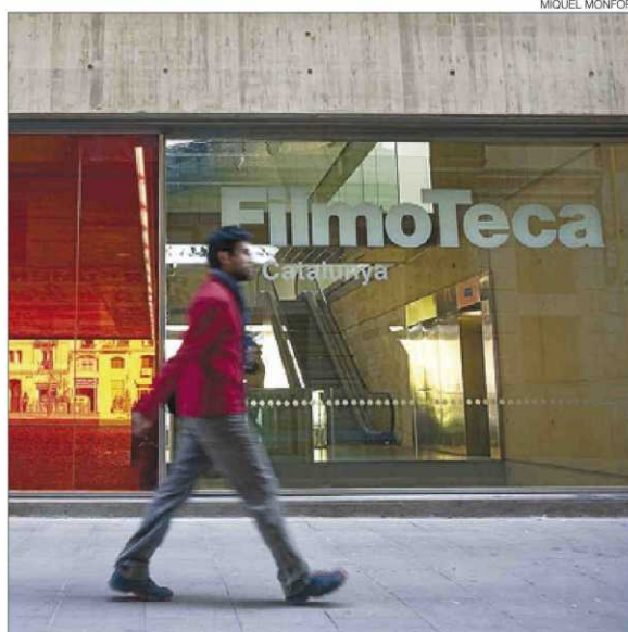
► Detall de la façana de la nova Filmoteca del Raval.

Segons va explicar ahir Fèlix Riera, director de l'Institut Català de les Empreses Culturals (ICEC), el cost de la nova Filmoteca, obra de l'arquitecte Josep Lluís Mateo, pujarà a 15,7 milions d'euros, 1,5 dels quals