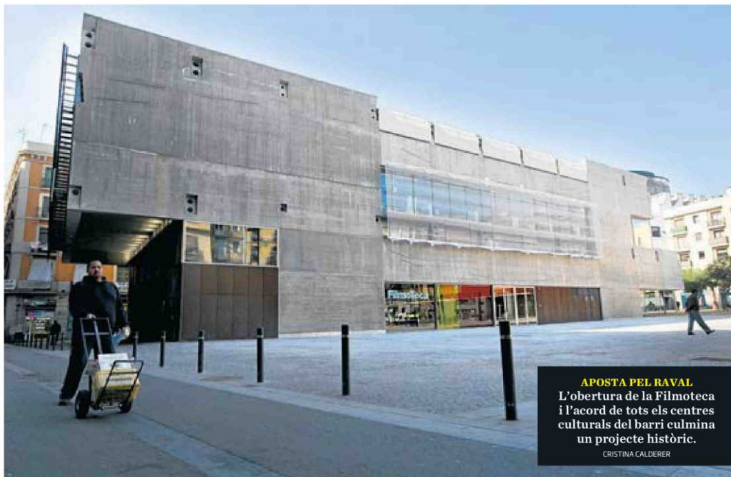
APOSTA PEL RAVAL L'obertura de la Filmoteca i l'acord de tots els centres culturals del barri culmina un projecte històric. CRISTINA CALDERER