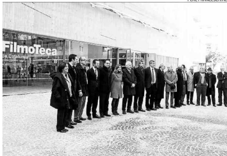
Autoritats i membres de les entitats culturals del Raval, a la Filmoteca