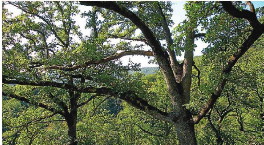
EL RICARD (SALARSA) BOSC DE ROURES (26,6 HECTÀREES)

El tret més rellevant d'aquest bosc del Montsià, incl3s al parc natural dels Ports, és que es tracta de la fageda més meridional d'Espanya. Hi ha arbres de fins a 22 metres d'altura i de més de 200 anys.