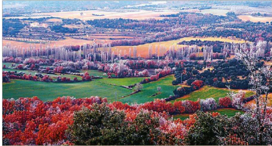
LA MITJANA DE LLEIDA BOSC DE RIBERA (20 HECTÀREES)