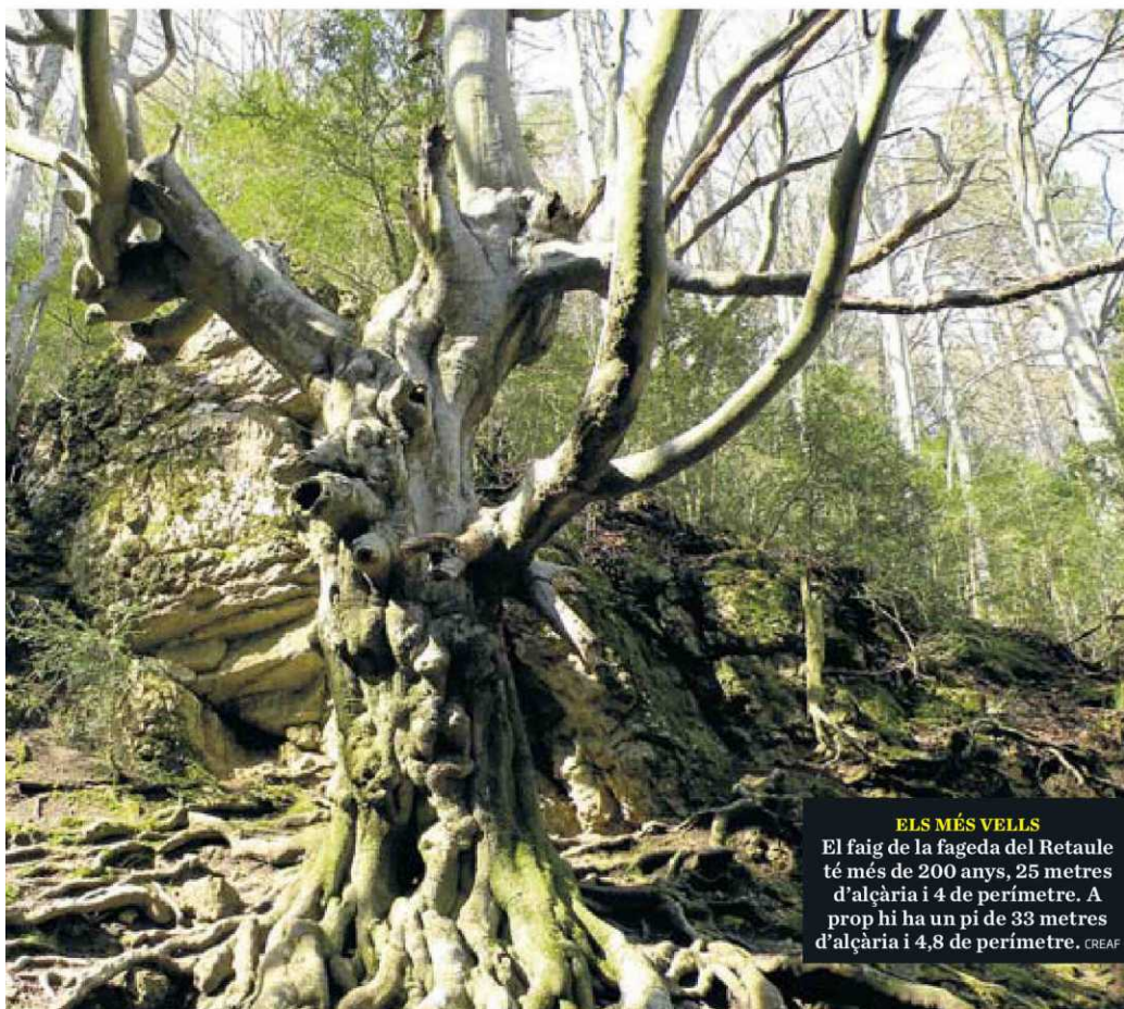
ELS MÉS VELL El faig de la fageda del Retaule té més de 200 anys, 25 metres d'alçària i 4 de perímetre. A prop hi ha un pi de 33 metres d'alçària i 4,8 de perímetre. CREA F

Els agricultors i els ramaders han estat, tradicionalment, considerats els jardiniers del bosc, ja que a través de les seves activitats els han mantingut en equilibri. Una altra peça clau són els propietaris privats, que tenen la meitat d'aquests boscos. El programa Salvans, a Girona, fa acords de custòdia amb propietaris forestals per conservar rodals amb valors rellevants. ■