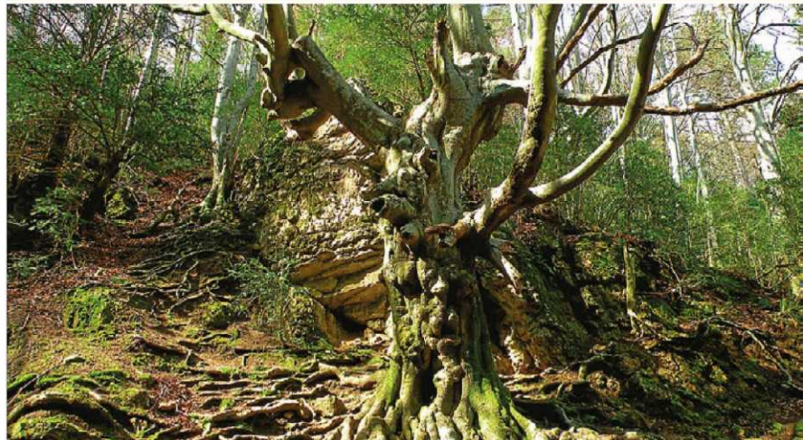
EL RETAULE BOSC DE FAJOS (10,5 HECTÀREES)

A la mateixa ciutat de Lleida, gràcies a la vitalitat del Segre, sorgeix un espai en què abunden els pollancre, els saúcs, els freixes i els verns. Els autors ho consideren un model de gesti3 sostenible, compatible amb les visites.