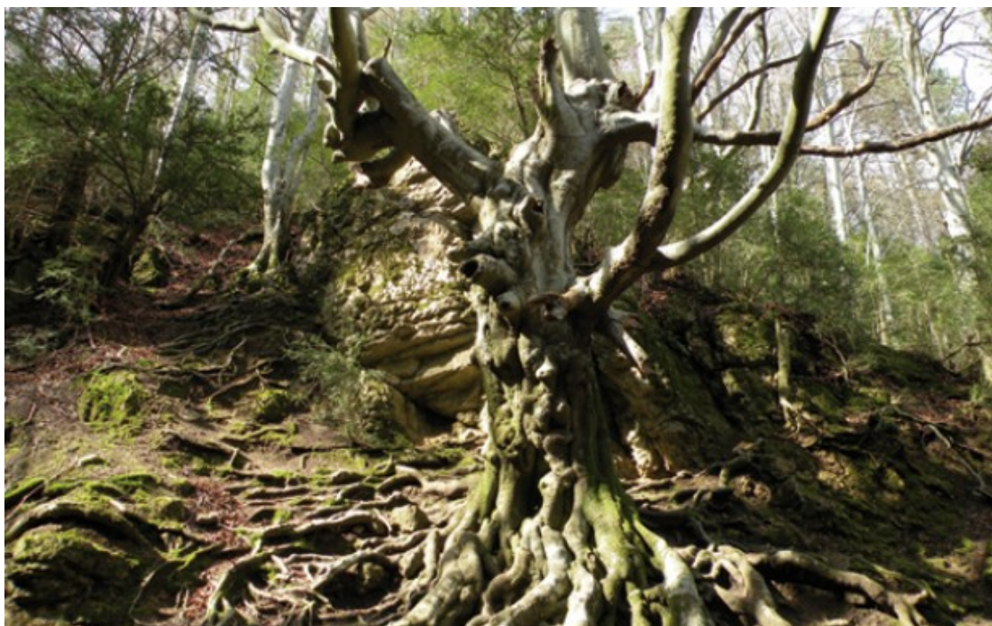
La fageda del retaule, el millor bosc de les Terres de l'Ebre

Catalunya ha catalogat els seus boscos singulars en una iniciativa pionera a Europa. L'inventari en recull un total de 292 amb valors únics i pretén ser una eina per a millorar-ne la gestió. La Generalitat, un cop feta la catalogació, hi proposa vies d'actuació