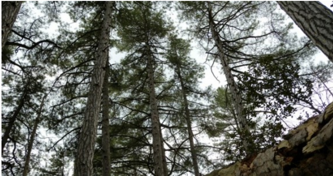
Bosc de la Salada