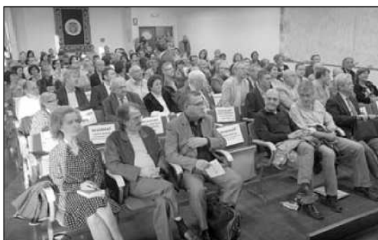
La sala es va omplir i hi havia gent en peu.