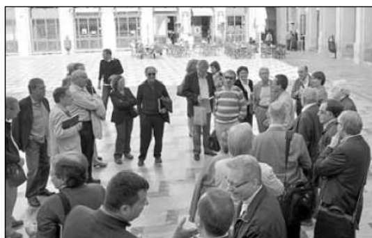
Els membres de l'IEC van visitar l'Alcoi històric.