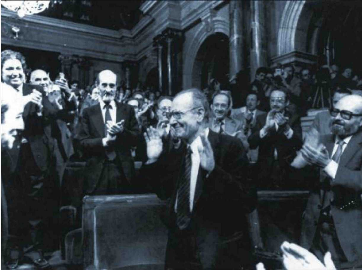
Heribert Barrera, en el día de su elección como presidente del Parlamento catalán, el 10 de abril de 1980.