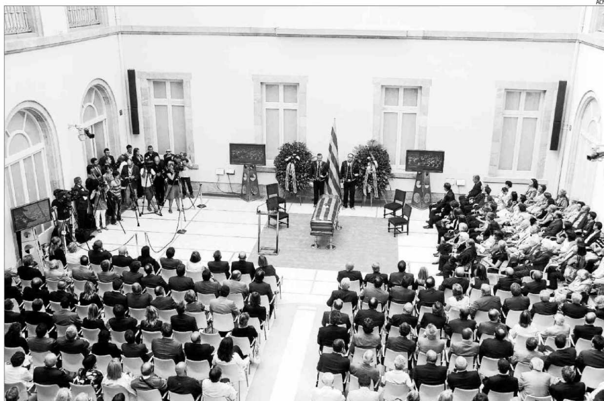
Imatge general de la Sala de l'Auditori del Parlament durant la cerimònia del funeral laic.

El fèretre, cobert amb una senyera, va ser custodiat per quatre Mossos d'Esquadra de gala en servei de vetlla, i va ser flanquejat per les corones de flors del Parlament i del president i el govern de