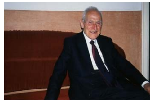
Generalitat de Catalunya