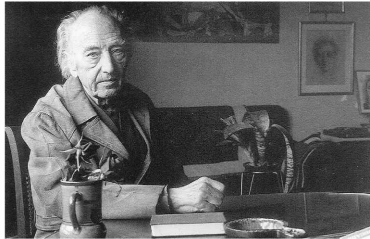
El poeta Agustí Bartra i Lleonart, que estableció su residencia en Terrassa en 1970.

quienes le esperan, en especial Telémaco, apenas un adolescente que busca su propio camino.