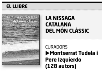
LA NISSAGA CATALANA DEL MÓN CLÀSSIC