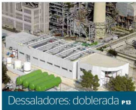
Dessaladores: doblorada P13