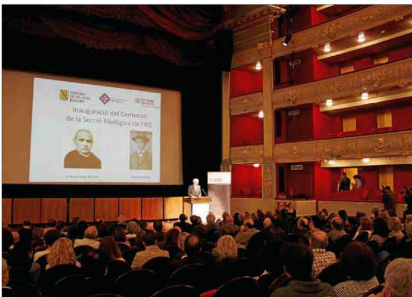
Vista general del Principal durante la intervención de Salvador Giner, con la proyección de las imágenes de los dos homenajeados, Antoni M. Alcover y Pompeu Fabra.