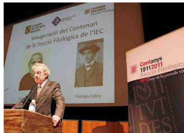
El president de l'IEC fou el primer a intervenir en l'acte al Principal.

là; l'italià que s'equiparia amb el gal·lec; i el romanx, minoritari en parlants com el basc". "Però en lloc de dir que això, es converteix en una torre de Babel, a Suïssa practiquen el respecte a la diversitat i seria una falta de respecte no considerar-ho així. "La retolació de l'estació de Berna està fins i tot en romanx". "Aquest és el tipus d'univers que voldríem", sentencià. •