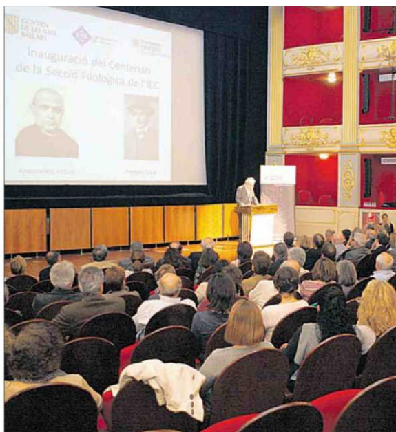
El Institut d'Estudis Catalans celebró su aniversario en el Principal.