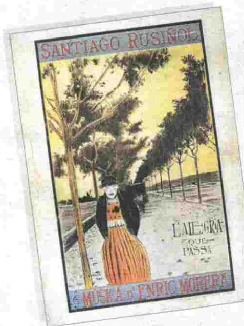
A la izquierda, portada de la primera edición de «L'alegria que passa». A la derecha, una pintura de Rusiñol

La obra completa de Rusiñol está integrada por más de un centenar de obras publicadas en primera edición entre 1894 y 1936, en primera edición, y de más de un millar de artículos aparecidos entre 1883 y finales de los años veinte. Según explicó ayer Panyella, Rusiñol fue una «figura tremendamente popular, y no populista, como le tildaban sus adversarios», pero algunos de sus trabajos no son en la actualidad ac-