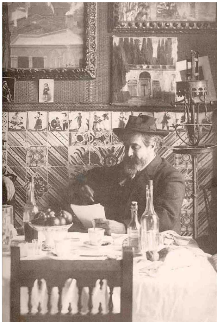
Santiago Rusiñol, al seu refugi del Cau Ferrat de Sitges

L'usuari trobarà els llibres digitalitzats partint sempre com a referència de la primera edició impresa —per exemple, l'edició de bibliòfil de Jardins d'Espanya . També hi ha rarieses com Andalusia