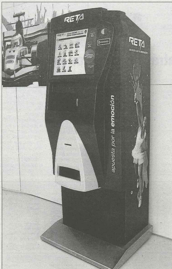
Máquina de apuestas de una empresa del País Vasco.