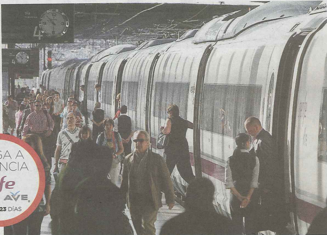
Viajeros descendiendo del Ave en Madrid.

Las agencias de viaje ya estuvieron reunidas el pasado lunes en Madrid con los responsables de Renfe Operadora para conocer las tarifas para mayoristas, que suelen ser sensiblemente más baratas que las que se venden al público en general. Aunque se emplazaron a otras reuniones, los operadores no quieren esperar, ya que no falta ni un mes para que las dos capitales estén comunicadas en tan sólo una hora y media. Las agencias de viaje van de la mano con los hoteleros, a los que han solicitado ofertas com-