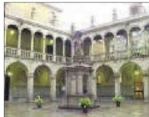
L'Institut d'Estudis Catalans.

El govern de la Generalitat de Catalunya va acordar ahir, dimarts 31 d'agost, concedir la Medalla d'Or de la Generalitat a l'Institut d'Estudis Catalans (IEC), en reconeixement a la seva tasca d'alta recerca en els àmbits de la cultura catalana al llarg de més d'un segle, la constància de la voluntat d'exercir l'autoritat en relació amb el present i el futur de la llengua catalana, així com el propòsit d'excel·lir en totes les matèries científiques i huma-