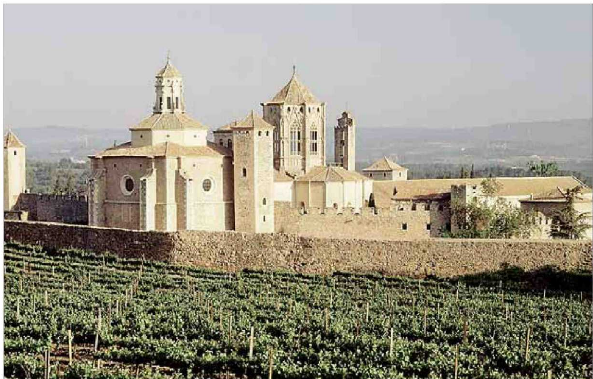
Vista del monestir de Santa Maria de Poblet, que ha estat guardonat amb la Medalla d'Or de la Generalitat

L'Institut d'Estudis Catalans va ser fundat el 18 de juny de 1907 per iniciativa d'Enric Prat de la Riba, que aleshores era president de la Diputació de Barcelona. Els seus principis bàsics són el rigor científic, la catalanitat i l'obertura a l'exterior. Entre els seus objectius fonamentals, trobem la recerca en els àmbits de la cultura catalana, com ara la metodologia històrica aplicada a les ciències humanístiques, l'estudi, la codificació i el desenvolupament