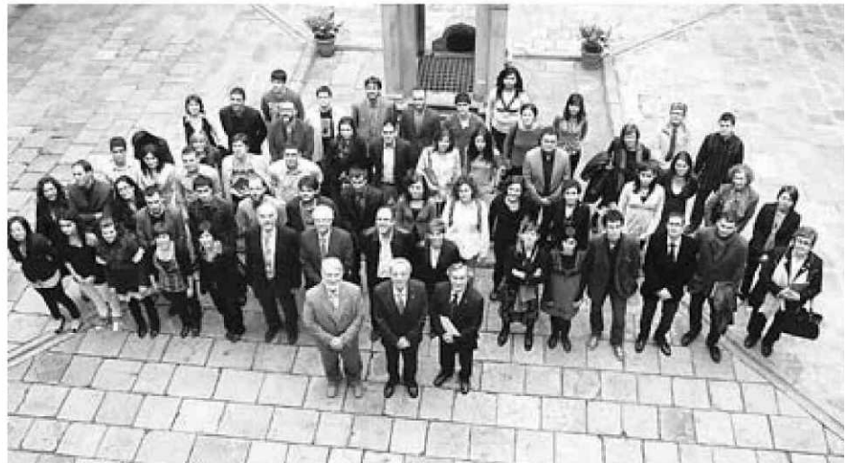
Els premiats, ahir a la tarda, al pati de l'IEC.