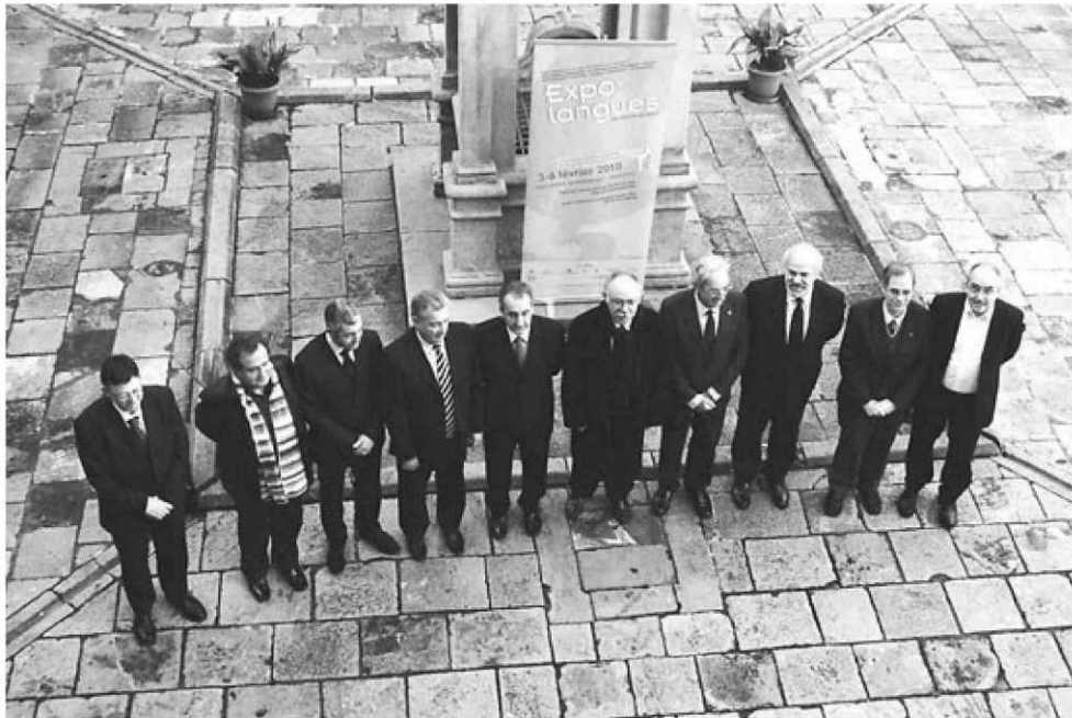
Els representats de les institucions dels territoris de parla catalana, ahir a la seu de l'IEC.

Presentacions del Centre de Terminologia Termcat i del domini d'internet .cat. Conferències sobre la unitat i la diversitat de la llengua catalana i al voltant de les llengües locals en societats multilingües. Trobades d'estudiants. Parla-ments de personalitats reconegudes internacionalment que parlen català, com per exemple Cyril Despres, guanyador del Dakar 2010 en la categoria de motos. Poesia, música i teatre. El català, del 3 al 6 de febrer al pavelló 5.2 de la Porte de Versailles de París, no pensa desapropiar l'oportunitat que significa esdevenir la primera llengua que no és l'oficial de cap estat a ser convidada en l'Expolangues. La projecció d'un vídeo que demostra que el català és una llengua comú mitjançant imatges com les de Pep Guardiola entrenant el Barça, la policia andorrana en un acte de servei, una família valenciana celebrant el Nadal i un locutor anunciant l'alineació de l'equip de l'USAP de Perpinyà servirà per inaugurar la presència catalana en la fira. De la cloenda, se n'encarregarà Comediants i en els dies previs diferents anuncis al metro de París i un espot, que s'emetrà fins a dues-centes vegades per televisió protagonitzat per un rostre popular a França com és el