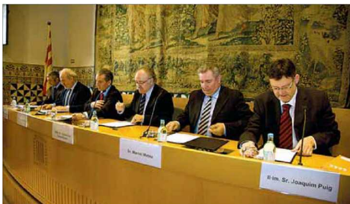
Els sis representants institucionals que van signar el manifest ■ NICOLA MESKEN