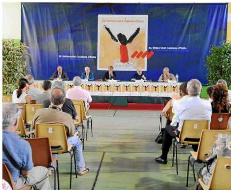
Prada de Conflent acomiadà els centenars de persones que han passat enguany per la UCE.

En aquesta edició, la participació il·lenca ha augmentat respecte d'altres anys, ja que en total els alumnes de les Balears n'han suposat gairebé el 20%. Entre professors, alumnes, periodistes i altres participants, es calcula