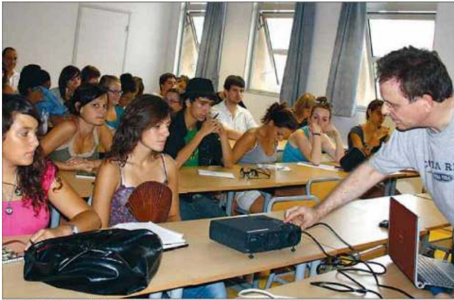
L'assistència a classe ha estat un dels factors destacats en la cloenda de l'UCE ■ UCE

Avui es clausura la 41 edició amb un balanç satisfactori d'assistència a cursos i actes dels 2.000 participants