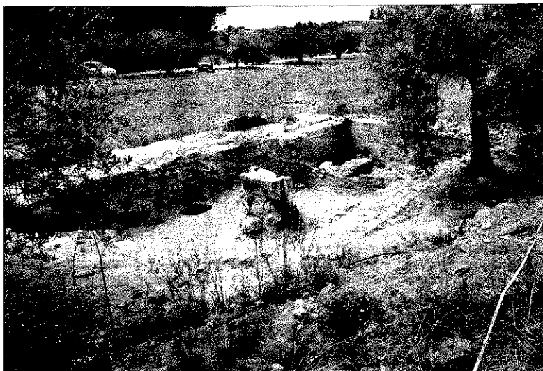
Imagen de un yacimiento localizado en la zona de Els Molins Nous, dentro del término de Riudoms.

Otro de los resultados obtenidos es el gran cambio en la estructura de población que fue introducida por los romanos en el periodo republicano (entre el segundo y primer siglo antes de Cristo). Se rompió la estructura ibérica con