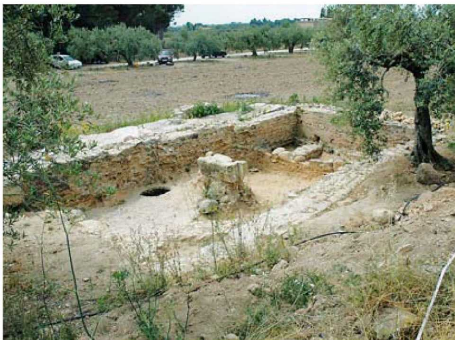
Jaciment romà de Molins Nous, a Riudoms, un dels que s'han estudiat.

L'equip multidisciplinari que ha fet el treball ha recorregut 245 quilòmetres quadrats. S'ha pentinat pam a pam el terreny i això ha permès treure unes primeres conclusions. La primera, la que afecta el paisatge, és que en època romana, tot i l'increment dels cultius, «la relaci3n entre les