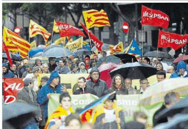
En octubre pasado, miles de valencianos se manifestaron a favor de la lengua. I. GARCÍA

¿ESTÁ EN PELIGRO DE EXTINCIÓN EL VALENCIANO? www.publico.es/231731