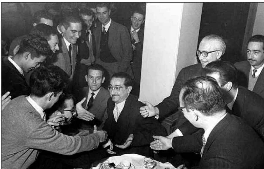
Joan Fuster rebent felicitacions al sopar dels premis Selecta del 13 de novembre del 1956. L'últim a la dreta és Pedrolo

La Universitat de València produeix el primer gran documental sobre la vida i l'obra de l'intel·lectual