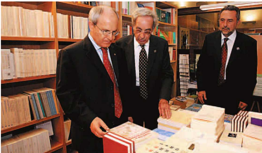
El president Montilla, ayer en el Institut d'Estudis Catalans