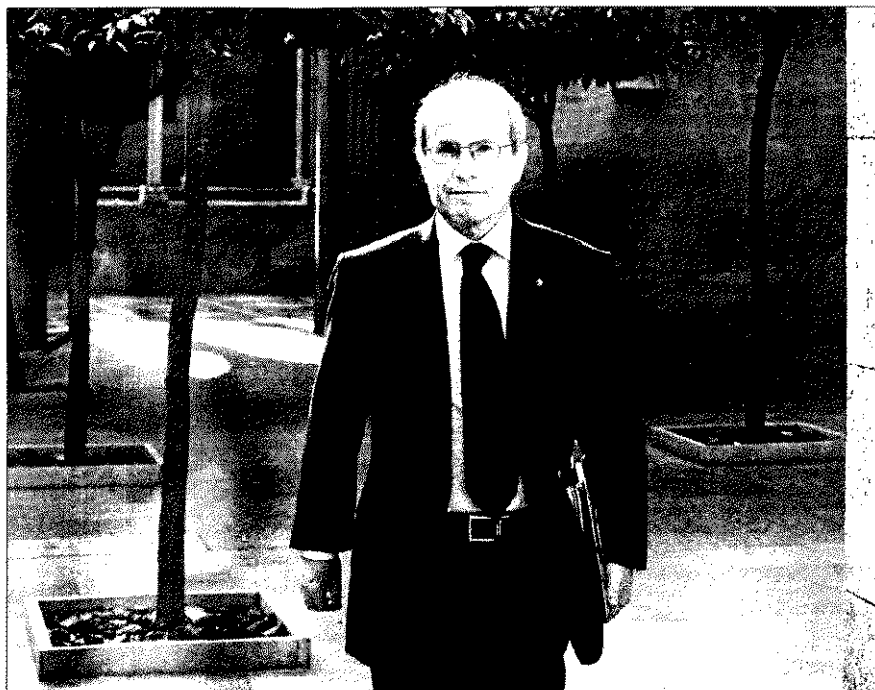
El presidente de la Generalitat, José Montilla, en una imagen tomada en Palau.

Así, el presidente habló de nuevo de «trabajo» y de «esfuerzo», como ya hizo en su discurso parlamentario en el reciente Debate de Política General, pero no acabó de concretar cuáles son sus recetas para darle la vuelta a la tortilla y conseguir que los catalanes pasen de la perplejidad al optimismo que