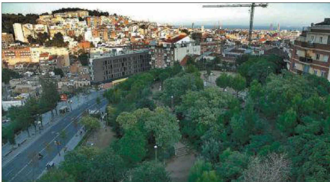
Jardines situados en el barrio del Putxet que llevarán el nombre de Mercè Rodoreda.