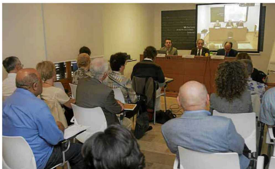
Ahir demat3 s'iniciaren les pon3ncies de l'acte de commemoraci3, despr3s de la presentaci3 que en feren els organitzadors.