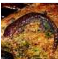
Un tritón del Montseny.