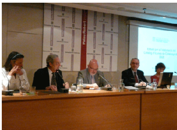
Acte de presentació del projecte de promoció turística Icones Catalanes

La iniciativa preveu l'elaboració d'un Catàleg d'Icones Catalanes per a la promoció turística, que permetran vincular la identitat catalana amb la promoció i el marxandatge, a través de la identificació visual.