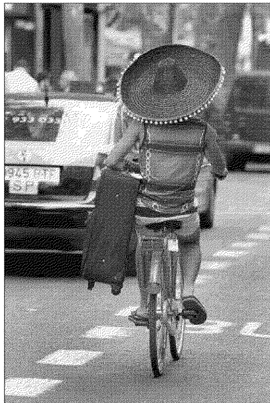
Un turista en Barcelona con un sombrero mexicano.

El proyecto, con un presupuesto de 100.000 euros, se puso ayer en marcha con la firma de un convenio con el Institut d'Estudis Catalans, el Fomento de las Artes y el Diseño y el Museo Nacional de Arte de Cataluña, que llevarán a cabo un estudio para seleccionar los nuevos iconos. Buscarán unos 500 entre los diferentes ámbitos,