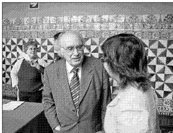
El autor dialogó con los asistentes al acto.