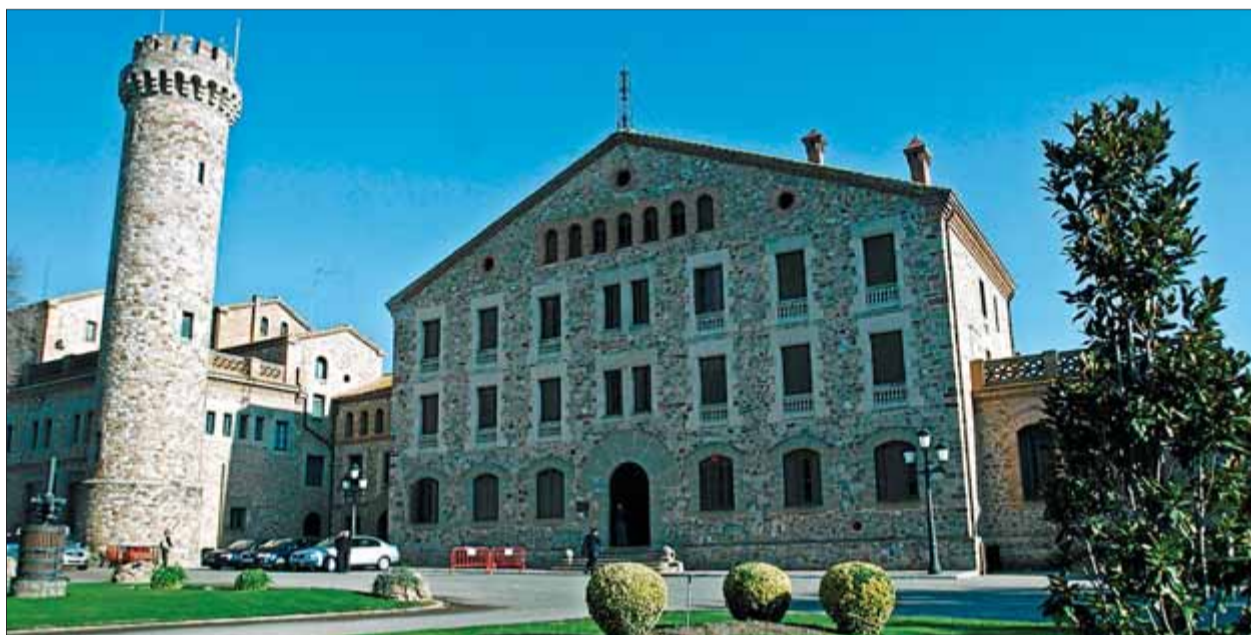
El centre de debat científic ocuparà una part de les dependències de Torre Marimon