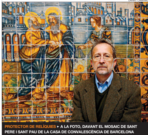
PROTECTOR DE RELÍQUIES ► A LA FOTO, DAVANT EL MOSAIC DE SANT PERE I SANT PAU DE LA CASA DE CONVALESCÈNCIA DE BARCELONA

el mateix, va construir el temple al voltant d'aquest punt.