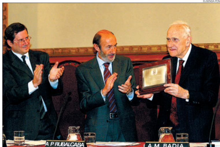
► Badia i Margarit rep una placa en presència de Màrius Rubiralta (esquerra) i Alfredo Pérez Rubalcaba.

«Profundament commogut» per les mostres d'adhesió i afecte rebudes, el doctor Badia va voler dedicar la seva intervenció a intentar expli-