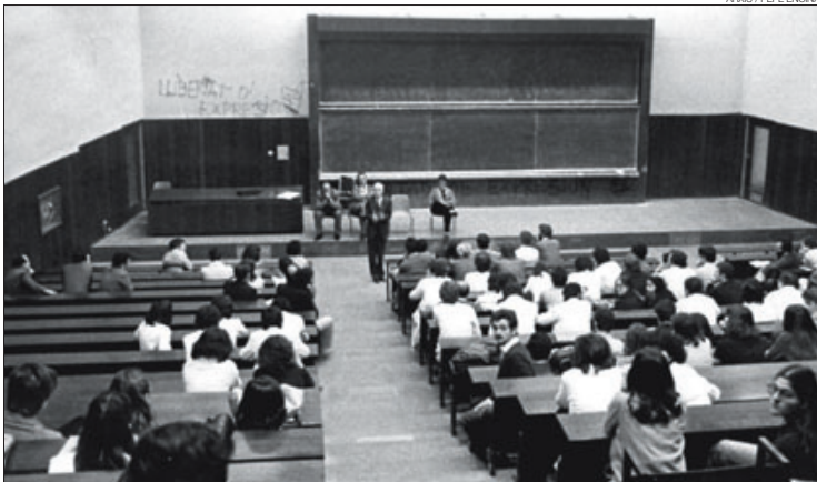
► L'exrector imparteix una classe a la universitat en els agitats anys de la transició política espanyola.