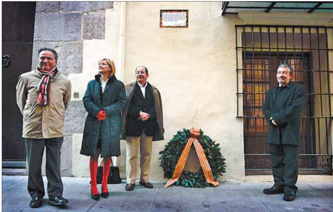
Miembros de la sección filológica del IEC depositan una corona de laurel.

En cualquier caso, y pese a la "gran preocupación" de los expertos, Vicent Pitarch quiso mostrar cierto optimismo en