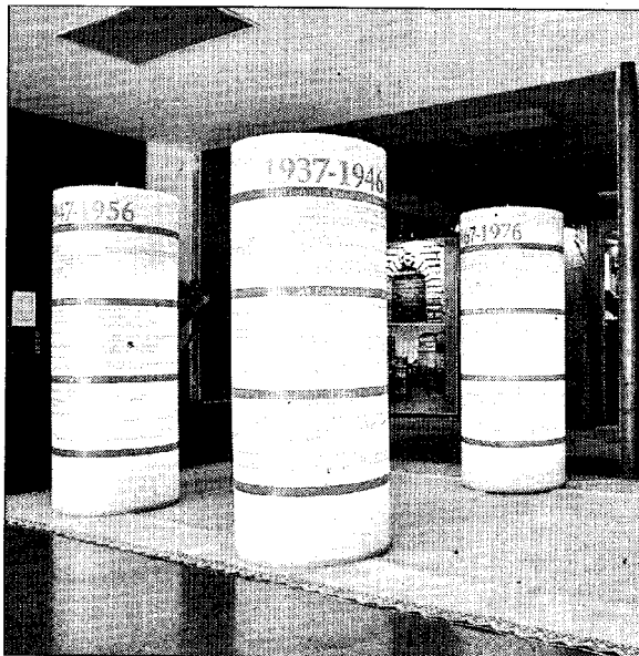
Deu espelmes, una per a cada dècada, donen la benvinguda.

L'exposició L'Institut d'Estudis Catalans, 1907-2007. Un segle de cultura i ciència als Països Catalans fa un repàs a la història de la institució, des dels seus inicis, el 18 de juny de 1907, fins a l'actualitat. Per fer-ho, la mostra es serveix d'imatges de gran format, textos i projeccions en un interessant recorregut situat al vestíbul de l'edifici Ramon Llull, a la Universitat de les Illes Balears i en la qual es fa un viatge a través dels protagonistes, els fets, el llegat i el futur de l'institució. Una història que, com recordà Giner, «ha tingut moments complicats i de veritable genocidi cultural» però