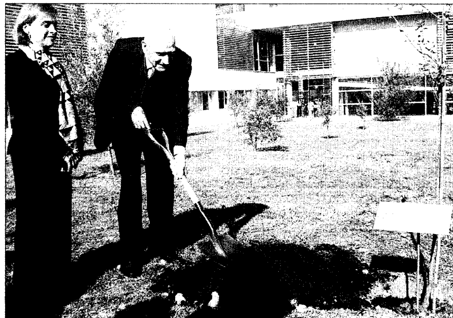
Antes del acto, el lingüista plantó un árbol en el campus.