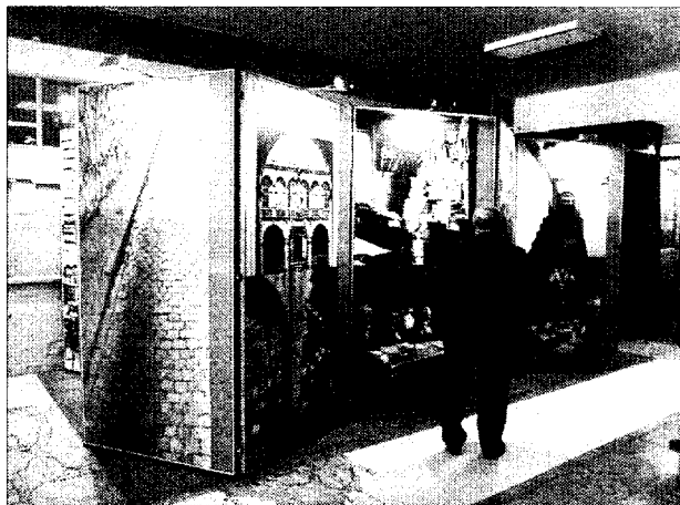
Imágenes del momento en el que se inauguró la muestra en la UIB.