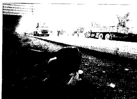
L'impacte va ser de grans proporcions.

Un conductor de 53 anys morí ahir migdia en xocar la seva furgoneta contra un camió a la carretera vella d'Inca a l'altura de Binissalem. La carretera quedà tallada al trànsit. ■ 23