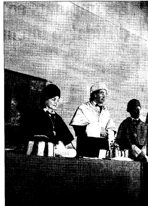
El filòleg català en el moment que la rectora de la UIB el nomena doctor honoris causa.

També, i seguint la tradició, es va procedir a la plantació d'un arbre als jardins del campus en memòria del nomenament del nou doctor honoris causa, que va escollir per a l'ocasió una alzina.