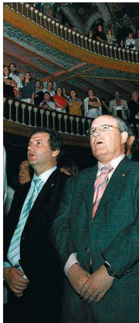
L'escriptor va ser el centre d'una nit que es va cloure amb el cant d'«Els segadors» i que va comptar amb la presència de Jordi Hereu i José Montilla ■ RUTH MARIGOT

perquè la vida d'escriptor no és fàcil sinó complexa i problemàtica. La seva justificació són els lectors; no els massius sinó els de qualitat, que participen en l'obra i la recreen. Jo mateix sóc un gran lector i de les coses que més agrait estic és dels llibres, que m'han influït més que cap altra cosa al món», declarava l'escriptor. I com si fos una premonició, el muntatge de recollida del premi, al vespre, era tot ell un homenatge als lectors, és a dir, al públic assistent, ja que la seva imatge era projectada dalt de l'escenari, com un mirall.