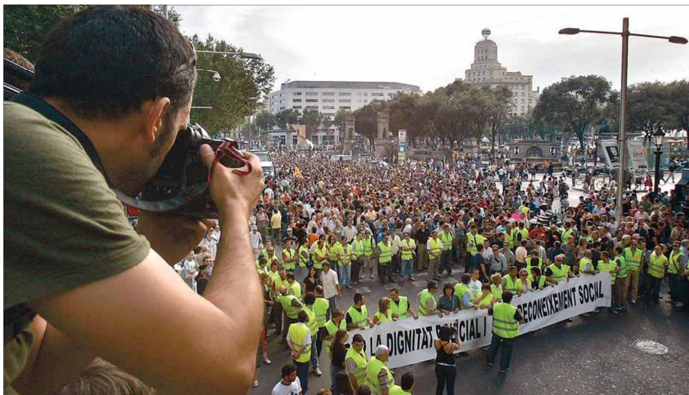
Més de 4.000 mossos concentrats a la plaça de Catalunya de Barcelona abans d'iniciar la manifestació contra l'actuació de la conselleria ■ FRANCESC MELCION

BARCELONA • Demanen la dimissió del conseller d'Interior en una manifestació massiva EUROCOP • Europa critica la publicitat dels suposats mals tractes ■ P30