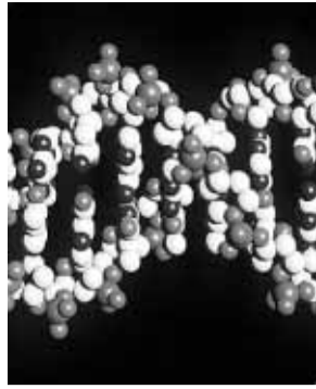
Identificadas las claves genéticas de varias dolencias 31