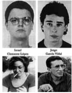
Cae en Barcelona el último comando de los Grapo 24