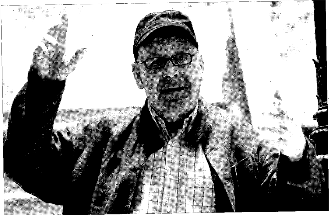
El escritor Baltasar Porcel fotografiado, ayer, en Barcelona.

«Este ha sido un año curioso», comentó. Tras superar un cáncer y el homenaje que editores y escritores le rindieron la semana pasada en La Pedrera, se prepara para unas jornadas que se organizarán en Mallorca en su honor. Allí, los carteles con su rostro han apelado a la participación electoral durante la última cam-