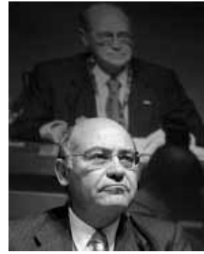
Díaz Ferrán inicia su presidencia de la CEOE 72