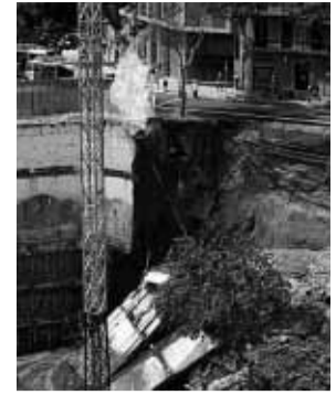
Suspendida la licencia de obras de la isla Bayer Vivir