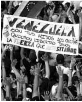
Gran manifestación estudiantil contra el Gobierno Chávez 9