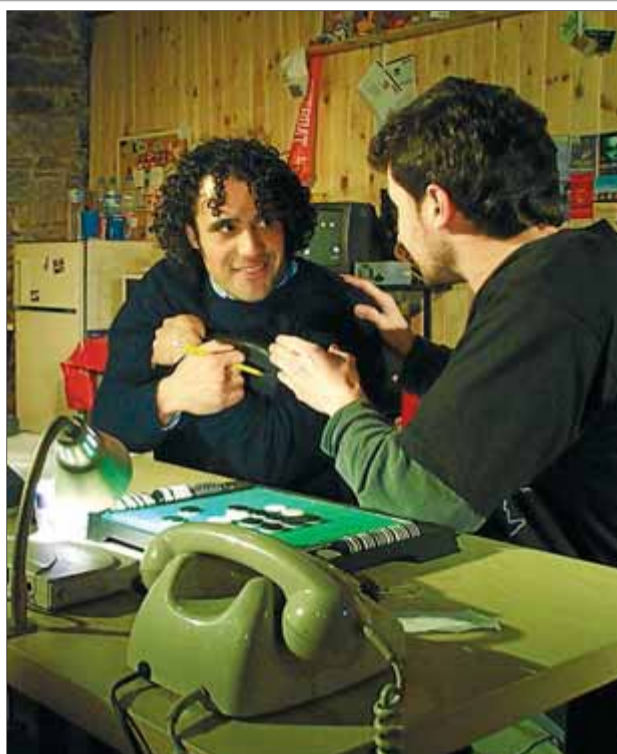
‘Tetris’, a l’esquerra, i ‘Wolfenstein’ són espectacles independents que es representaran diàriament al Versus Teatre

‘Wolfenstein’ i ‘Tetris’ s’estrenen al Versus i completen la trilogia escrita i dirigida per Jordi Casanovas