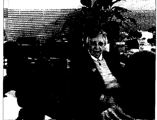
Creu Casas al laboratori de botànica de la UAB, en una entrevista recent per a un documental de l'IEC

Creu Casas era autora de més de dues-centes publicacions sobre briologia. Entre d'altres distincions, havia rebut la Medalla Narcís Monturiol de la Generalitat de Catalunya (1983), el Premi Fundació Catalana per a la Recerca (2002) i el Premi Crítica Serra d'Or pel llibre Flora dels briòfits dels Països Catalans: I Moltes (2002), editat per l'Institut d'Estudis Catalans. ■