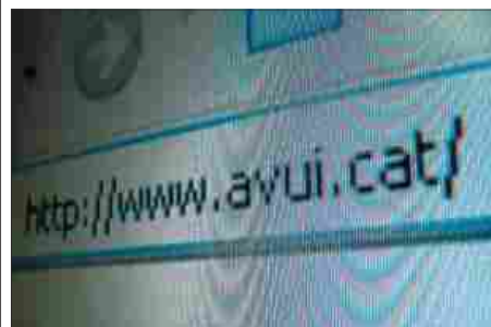
El domini '.cat' va ser autoritzat el setembre del 2005 i es va posar en marxa ara fa just un any