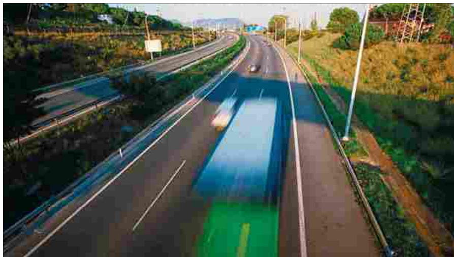
La por de les sancions ha fet que baixés la velocitat a les autopistes catalanes ■ XAVIER BERTRAL