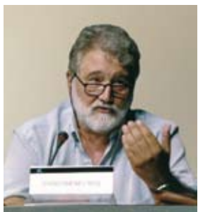
Joandomènec Ros, Catedràtic d'Ecologia de la UB i secretari general de l'IEC